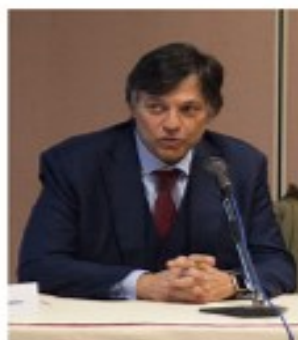
Nicola Sotira Direttore Generale della Fondazione Global Cyber Security e Responsabile del CERT di Poste Italiane